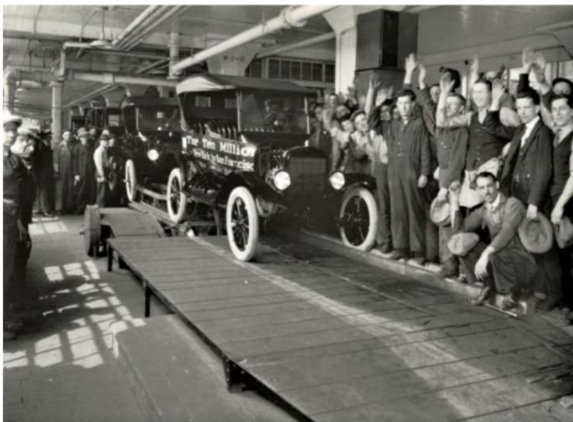
La dix-millionième Ford T sort de la chaîne, 1924.

QUESTION DE GÉOGRAPHIE : Géostratégie des espaces maritimes ET ÉTUDE DE DOCUMENTS EN HISTOIRE