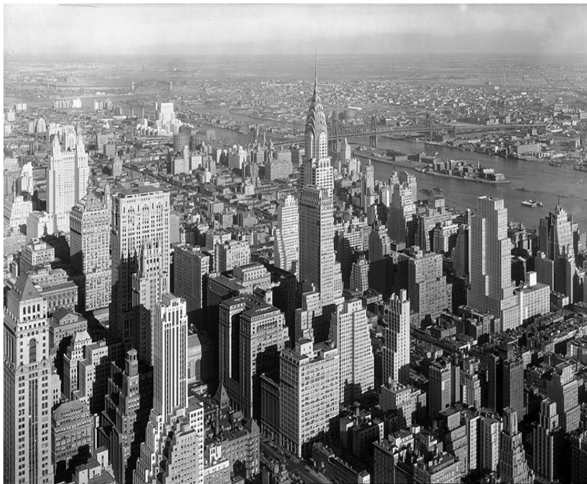
Manhattan (vue en 1932)

SUJET n°2 : QUESTION DE GÉOGRAPHIE : Mers et océans au cœur de la mondialisation ET ÉTUDE EN HISTOIRE